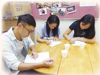
飯後感，家長義工認真填寫試食問卷