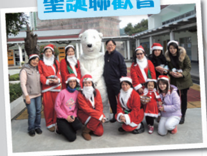
又到聖誕，又到聖誕。