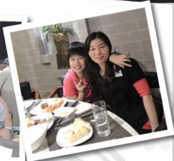
大家一齊醫吓肚先。