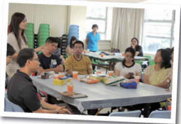
新舊會員互相交流。