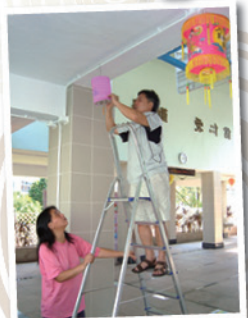
校園節日氣氛，全賴家長用心佈置。