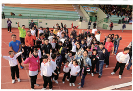
又到全校家長·師生參與的日子。