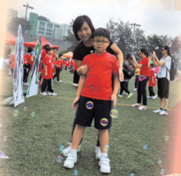
大人細路都喜歡玩嘅吹泡泡