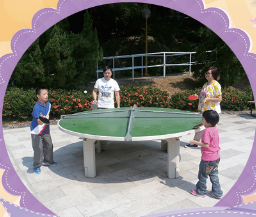
你一板、我一板，難得一家一齊玩。