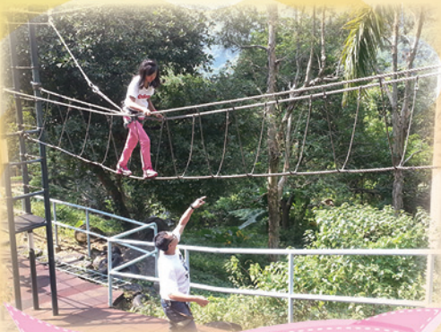
加油呀! 就快到終點。