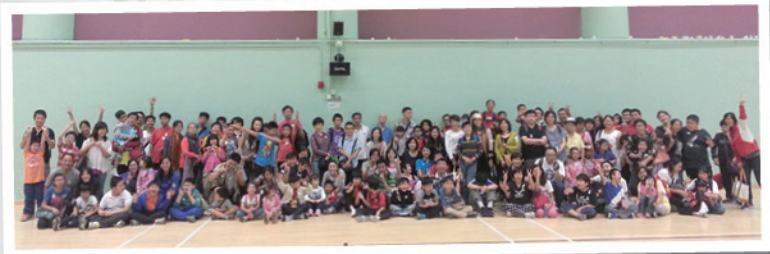
開開心心，渡過快樂的一天。